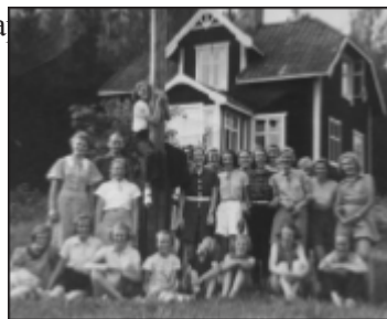
Ovan: Huvudbyggnaden c:a 1935